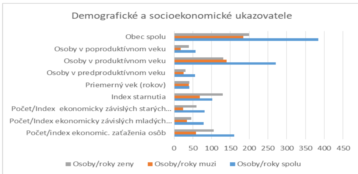
Graf 1: Demografické a socioekonomické ukazovatele 2017 (Zdroj: ŠÚ SR)

Veková skladba obyvateľov vykazuje minimálne prevládajúci podiel obyvateľstva poproduktívneho veku oproti obyvateľstvu predproduktívneho veku, pričom u žien je tento presah výrazný, u mužov je opačný. Základný ukazovateľ – index starnutia obyvateľstva dosahuje za obec 101,79 %, je mierne vyšší ako okresný priemer a nižší ako priemer Trnavského samosprávneho kraja, mimoriadne priaznivý je u mužov – iba 69,23 %, u žien dosahuje až 130 %.